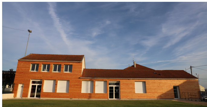
Restaurant scolaire des Tilleuls