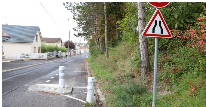
Rue du Général Leclerc

Au cours des 3 ème et 4 ème trimestres 2023, les travaux d'enfouissement des réseaux de téléphonie et de fibre par Orange sont programmés route d'Épernay, ainsi que la mise en place de nouveaux candélabres. Enfin, Châlons Agglo travaille activement pour réaliser la continuité de la piste cyclable . Le marché public est lancé.