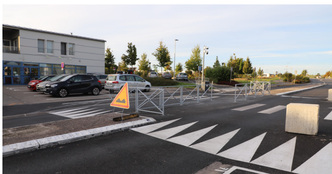
Avenue du Général de Gaulle